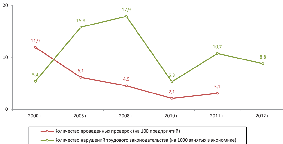
Рис. 1. Количество выявленных нарушений трудового законодательства (на 1000 занятых) в экономике и проведенных проверок (на 100 предприятий) Вологодской области

Для оценки этой взаимосвязи нами применялся корреляционный анализ. Корреляция проводилась между числен-