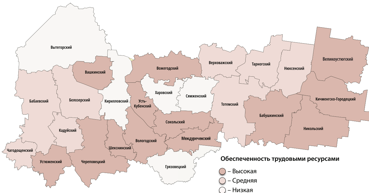
Рис. 1. Прогнозируемая кадровая обеспеченность экономики муниципалитетов Вологодской области к 2023 году

Составлено по: Сводный прогноз потребности экономики Вологодской области в трудовых ресурсах до 2030 года / Департамент труда и занятости населения Вологодской области. URL: http://depzan.gov35.ru/vedomstvennaya-informatiya/statistika/spros-i-predlozhenie-rabochey-sily (дата обращения 10.06.2018).