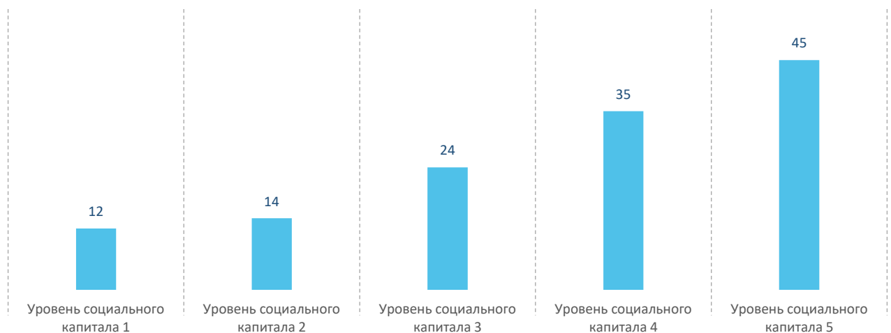
Рис. 3. Количество участвующих в формализованных видах общественной деятельности (в среднем по видам деятельности), в зависимости от уровня социального капитала, до 30 лет, %