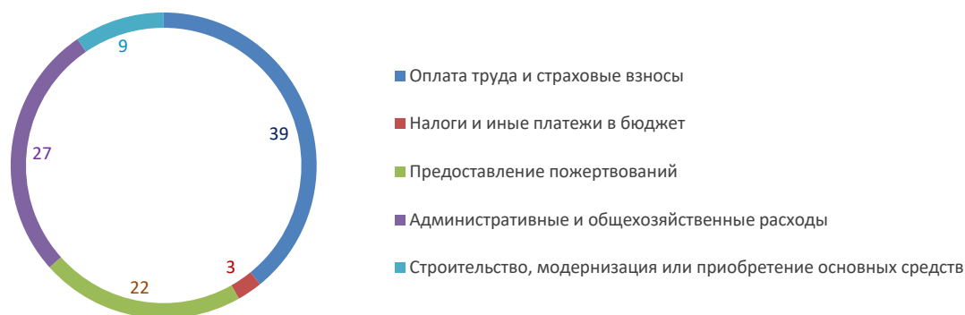
Рис. 3. Использование денежных средств и иного имущества социально ориентированных некоммерческих организаций за 2020 год (по всем субъектам РФ), %

Рассчитано по: Основные сведения о деятельности СОНКО по Российской Федерации за 2020 год. URL: http://www.gks.ru